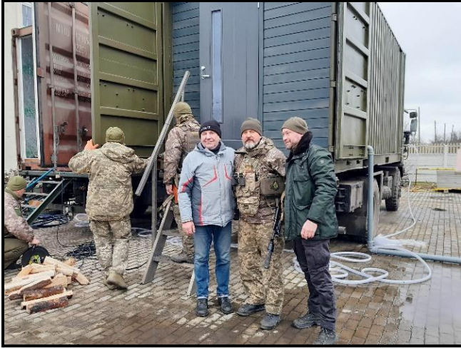
Esimeste konteinerite üleandmine 21.detsembril 2022.

Kompleksi üleandmisest on olemas Ukraina armee xxx väeosa kinnitusega üleandmiseakt.