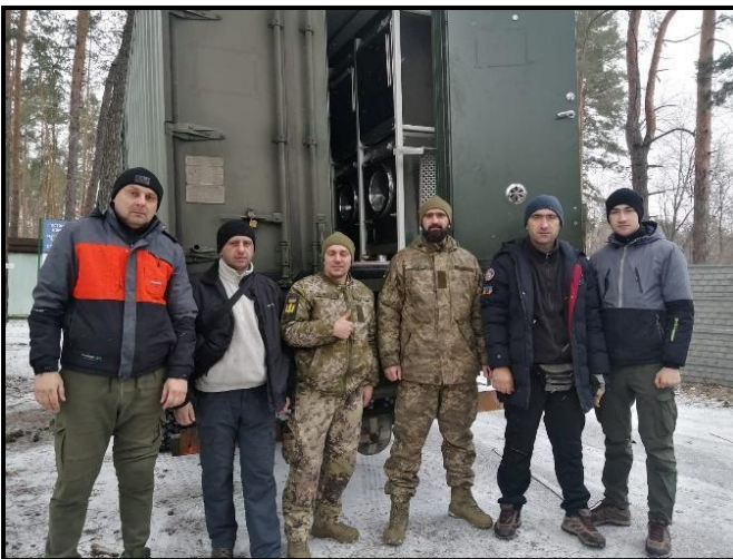
Pesumaja konteineri üleandmine 12 veebruar 2023